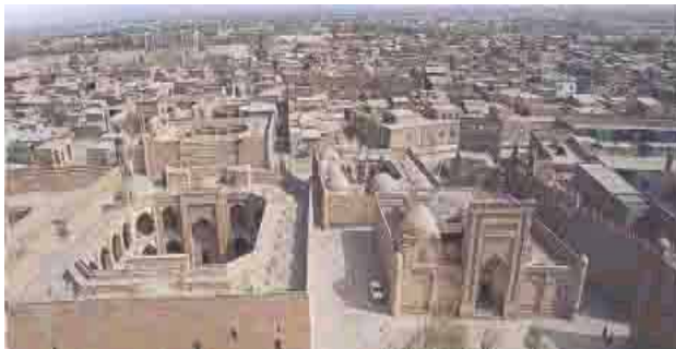
Ciudad de Ichan Kala -Uzbekistán-