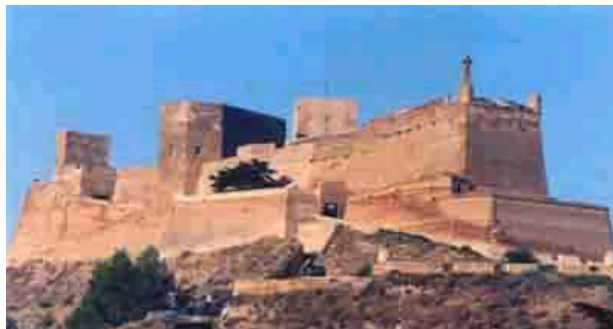
Gran Priorato de Hispania, en el Castillo Templario de Monzón (Huesca)