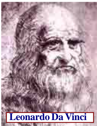
Leonardo Da Vinci

«Este Ateneo Masónico hunde sus raíces en el «cuatrocento», el nombre que recibe el siglo en el que surgió el movimiento humanista que despierta en Europa y especialmente en Italia en el siglo XV —años mil cuatrocientos— y que marca el comienzo del Renacimiento.